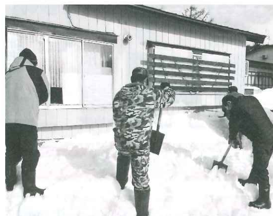
除雪支援事業（裾野地区）

3 前項第1号オに規定する一般会費(たすけあい会費)は、岩木支部及び相馬支部については、当分の間一世帯当たり1,000円とする。